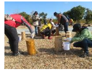
2050年の森を中心フィールドとする実践と 県下全域での展開